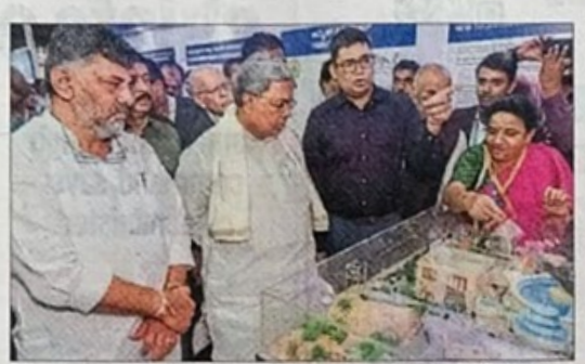
Chief Minister Siddaramaiah and Deputy Chief Minister D K Shivakumar look at a water treatment unit model displayed at Municipalika - 2023, the 17th International Conference and Exhibition at the Palace Grounds in Bengaluru on Monday

"In Bengaluru, there are 197 Indira Canteens. We will not only build more, but continue to charge the same rates (Rs 5 for breakfast and Rs 10 each for lunch and dinner),"he said,