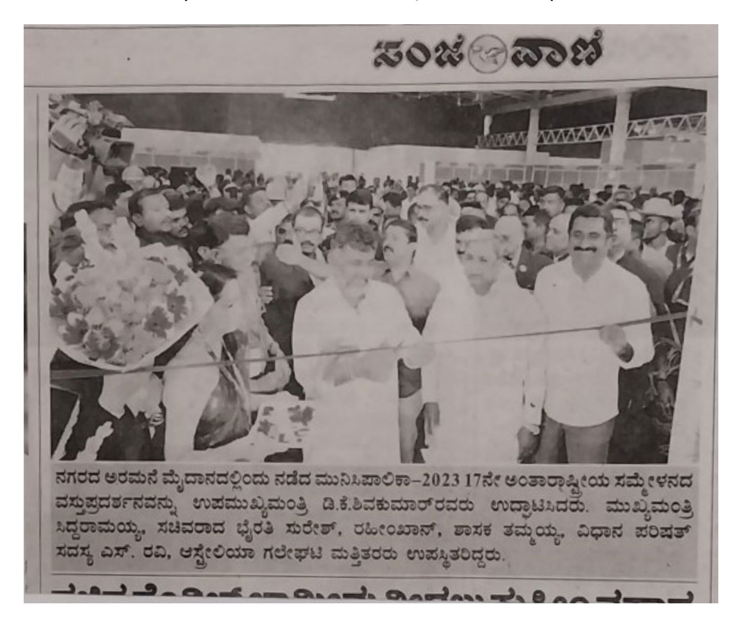
DyCM DK Shivakumar inaugurated the exhibition organised as part of 3 days Municipalika event. CM Siddaramaiah, and others were present