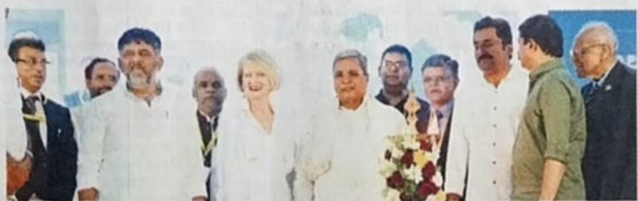
CM Siddaramaiah inaugurates the 17th International Municipal-23 Conference at Palace Grounds in Bengaluru on Tuesday, DyCM DK Shivakumar and BBMP Chief Commissioner Tushar Girinath look on

While addressing the gathering, CM Siddaramaiah said 38 per cent of people now live in the municipality and urban limits, and the government must provide water supply, sewage network, power and transport.