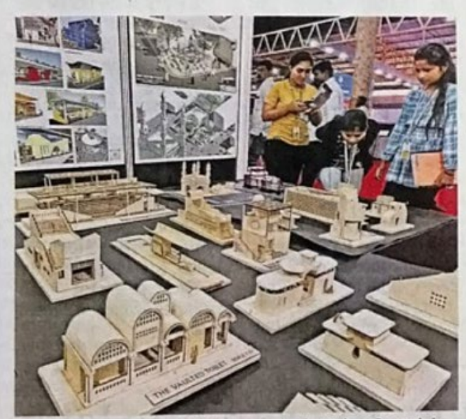
A stall at 'Municipalika 2023' being organised at Palace Grounds in Bengaluru, on Tuesday. SUDHAKARA JAIN

He said his government is committed to providing needed amenities to all the 316 town and cities and will ensure development of both rural and urban local bodies. "Bengaluru is one of the fastest growing cities in the country with a population of about 1.5 crore. Of the seven crore population in the State, three crore people live in urban land-scapes. The residents