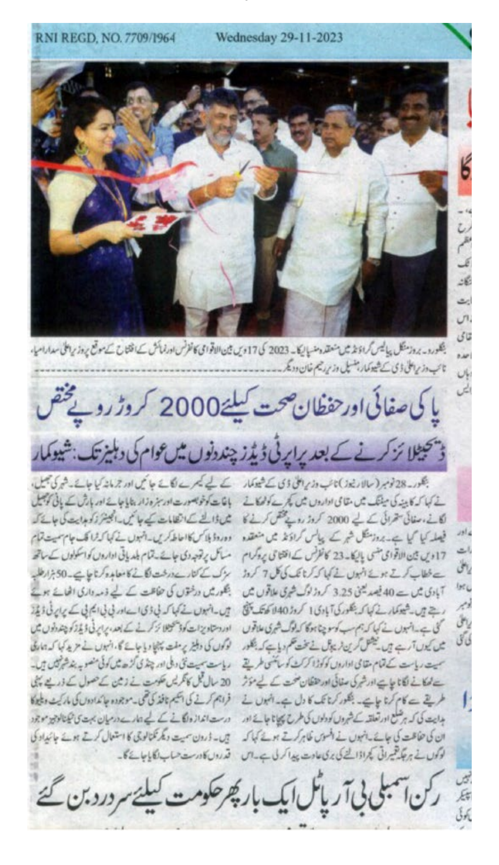
Rs.2,000 crores for the garbage disposal in ULBs across the state says CM Siddaramaiah